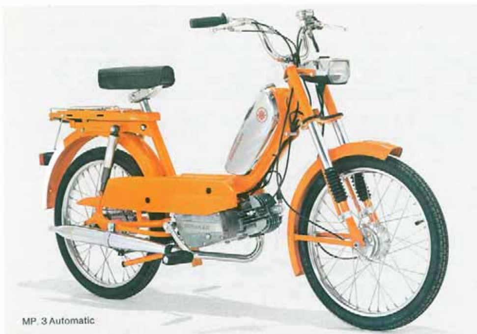
MP 3 Automatic