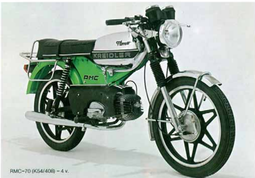
RMC-70 (K54/408) - 4 v.

Super-cockpit non-réflétant avec kilométrie et compte-tours, ainsi que des voyants pour les clignoteurs et les feux de route - serrure de contact.