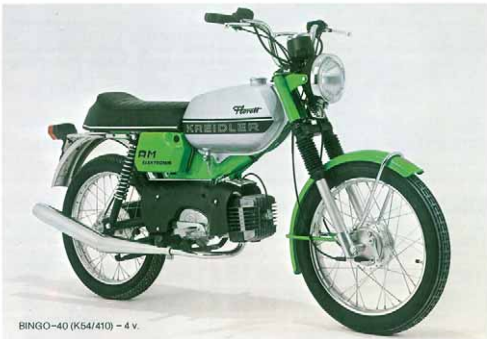
BINGO-40 (K54/410) - 4 v.

Vilebrequin multi-pièces forgé - circonférence trempée - bielle d'une seule pièce. Axe de piston et pied de bielle montés sur roulements à aiguilles. Ces pièces ont fait leurs preuves dans les compétitions les plus exigeantes.