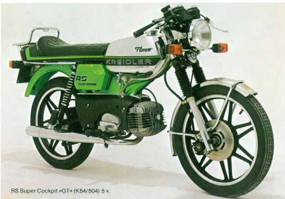
RS Super Cockpit «GT» (K54/504) 5 v.

Batterie sèche au cadmium. Contrôle de charge électronique suivant la température et la tension - redresseur à 3 diodes.