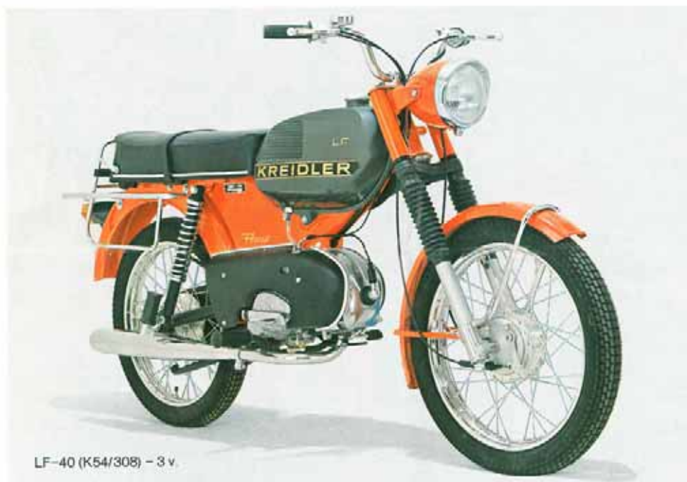
LF-40 (K54/308) – 3 v.

Cylindre super-large anti-bruit à surface de refroidissement optimale – paroi en Nikasil, garantissant une longévité et un usage forcé continu (plus de rodage).