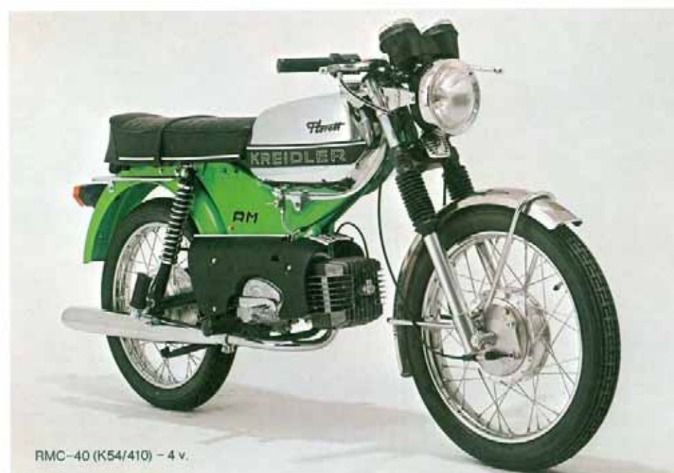
RMC-40 (K54/410) – 4 v.

Phare noir-mat avec verre de 160 mm \varnothing