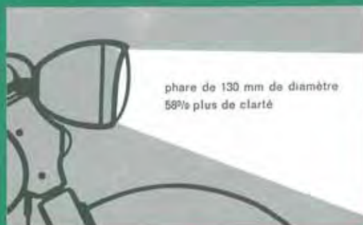
phare de 130 mm de diamètre 58% plus de clarté