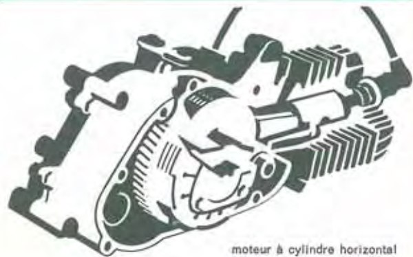
moteur à cylindre horizontal

Le cylindre horizontal en alliage léger a une paroi intérieure chromée dure. Avantages offerts: puissance exceptionnelle, grande longévité et consommation minime. La bonne évacuation de chaleur du cylindre et le refroidissement forcé par la turbine efficace permettant de rouler d'emblée à plein gaz avec la FLORETT.