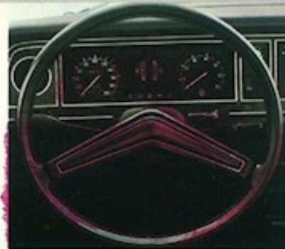
▲ Die mattschwarze Armaturenfond des XL

Die mattschwarze Armaturenfond verfügt zusätzlich über einen großen Drehzahlmesser und einen Tageskilometerzähler. Das Lenkrad ist mit schwarzem, griffigem Kunstleder bezogen, der Teppichboden farblich auf die Innenausstattung abgestimmt.