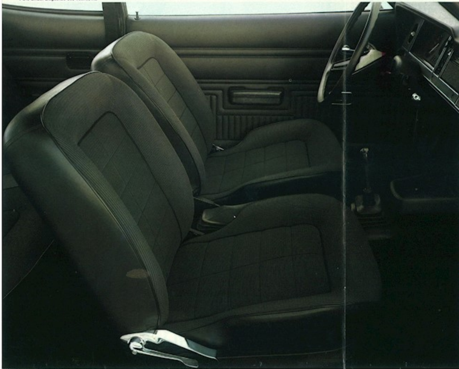
▼ Die Einzel-Liegesitze des Taunus XL