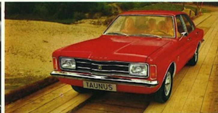
▲ Der 4törige Taunus XL