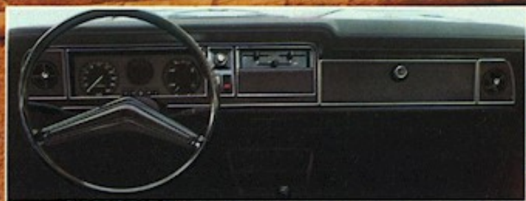
▼ Die Armaturenfrost des Taunus L