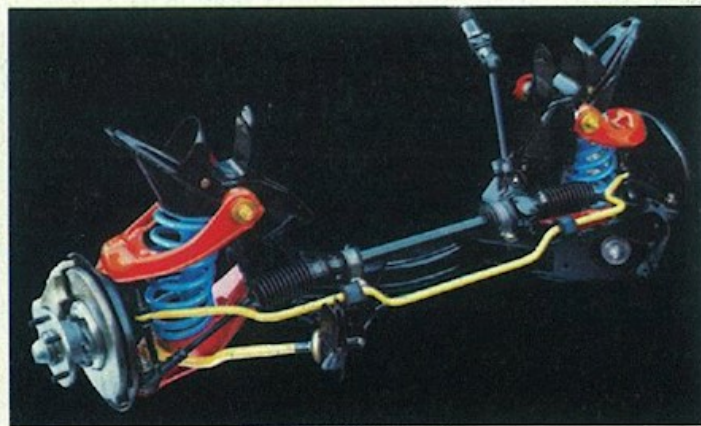
▲ Breitspur-Vorderachse mit Stabilisator