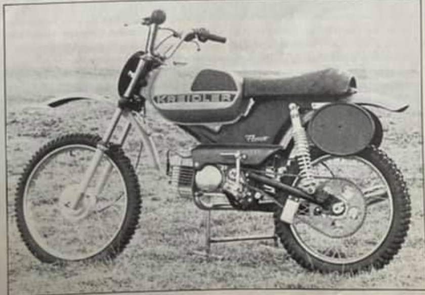
Om de relatie tot de straatmodellen van Kreidler te houden bleef de grote tank gehandhaafd.

Voor een prijs van f 2275, — levert Van Veen