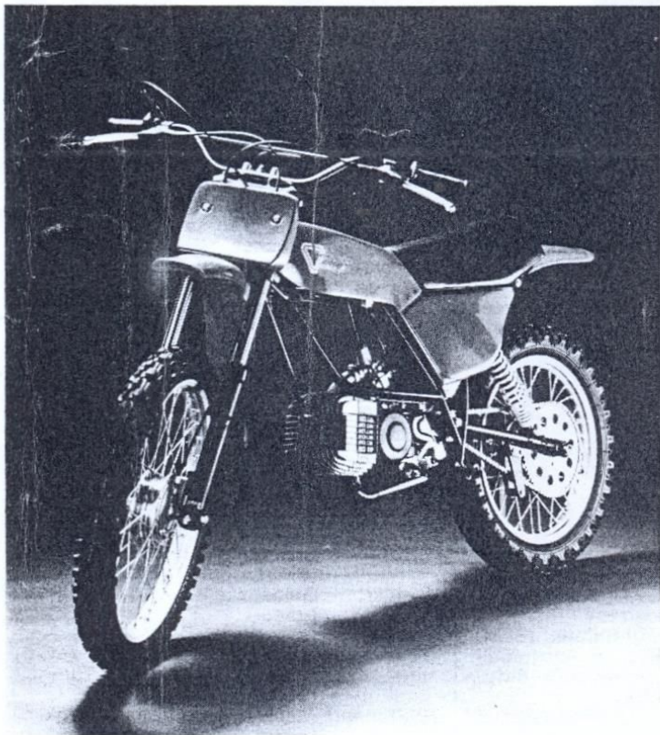
De Kreidler crosser is een verdere ontwikkeling van de bekende Gebben crosser.

der dan 50 machines op de markt te brengen.