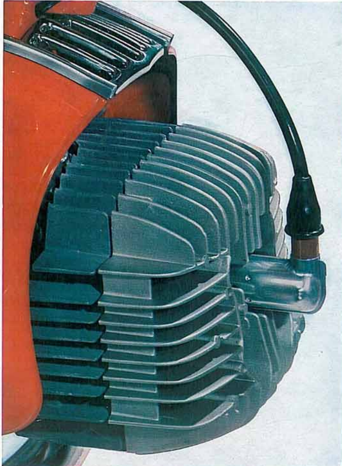
Reuze-ster-cilinder met vele, diepe koelribben (alleen bij "RS")

Importeurs voor België: Etn. BLOMME & LECOMTE n.v. 5, rue des Croisiers, DOORNIK tel. (069) 249.14